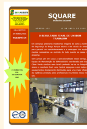
Square n.º 152 13 de Abril 2009