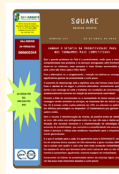
Square n.º 153 20 de Abril 2009