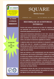
Square n.º 151 30 de Março 2009